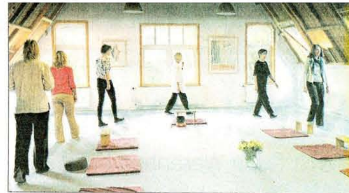
Die Leiterin ist die einzige, die zwischendurch das Wort ergreift.

Und so machen wir Kursteilnehmerinnen schon bald die erstaunliche Erfahrung, dass