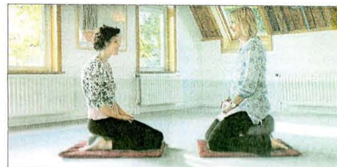
In der Stille wirkt sogar das Atmen laut.

wir uns – nach den ersten, schier endlosen Stunden der Peinlichkeit – an das Schweigen zu gewöhnen beginnen. Versunken sitzen wir auf unseren Meditationskissen und lauschen der Stille. Überlaut auf einmal jedes Atemgeräusch der Nachbarin, jedes Knacken der Gelenke, wenn wir uns von unseren Kissen und Matten und Holzbänkchen hochhieven in den Stand.